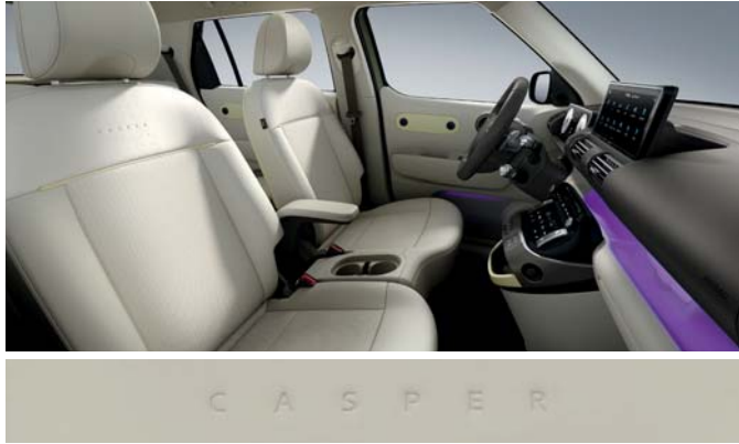
베이지/카키브라운 투톤(인조가죽 시트 / 버터 옐로우 포인트)

※ 베이지/카키브라운 투톤 인테리어는 '실내 컬러 패키지(뉴트로 베이지)' 선택 시 적용 가능합니다.