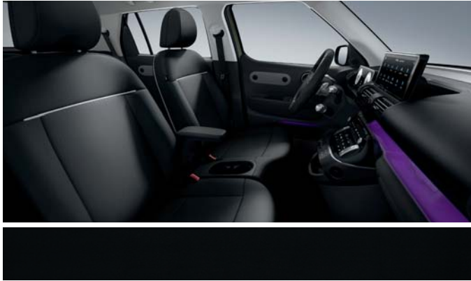
블랙 원톤(인조가죽 시트)