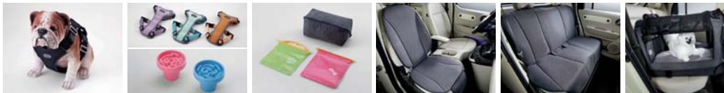
하네스 I (차량용, 소형/중형) 하네스 II (일상생활용, 소형/중형) / 컵홀더토이(1/2열 공용) 멀티 파우치 & 포터 포켓 (먹이용/배변용) 동승석 방우시트커버(1열) 방우시트커버(2열) PET 히팅 패드