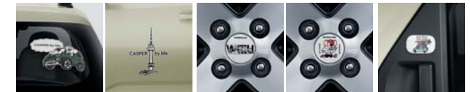
데칼 휠캡 리어 도어 핸들 밴드

* 동승석 시트백 보드는 컴포트 옵션 선택 시 장착 가능합니다. * 우산스탠드, 동승석 시트백 보드 테이블 2.0, 동승석 시트백 보드 트레이 2.0은 동승석 시트백 보드가 설치되어 있어야 장착 가능합니다. * 동승석 시트백 보드 트레이 1.0은 동승석 시트백 보드와 동승석 시트백 보드 트레이 2.0이 설치되어 있어야 장착 가능합니다. * 동승석 시트백 보드 트레이 2.0은 동승석 시트백 보드와 피드백 구조(자석)로 결합이 되는 상품입니다. * 에어백 스토리지는 동승석 시트백 보드 트레이 2.0에 결합하여 사용이 가능하며, 결합 해제 후 휴대하여 사용도 가능합니다. * PET 히팅 패드 상품 사진에 나와있는 카시트는 현대Shop(shop.hyundai.com)에서 별도 구매 가능합니다. * Hyundai by Me는 고객 맞춤형 액세서리 제작 서비스로 현대Shop에서 이용 가능하며, 상기 이미지 외에도 원하는 디자인 시안 선택 및 문구 입력을 통해 커스터마이징이 가능합니다. * 데칼은 소형/중형/대형 사이즈 중 선택이 가능합니다.