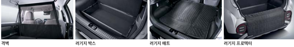
격벽 러기지 박스 러기지 매트 러기지 프로텍터