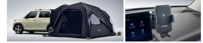
오토듀얼월레스 레굴러 차량용 핸드폰 무선 충전 거치대(흡착형)