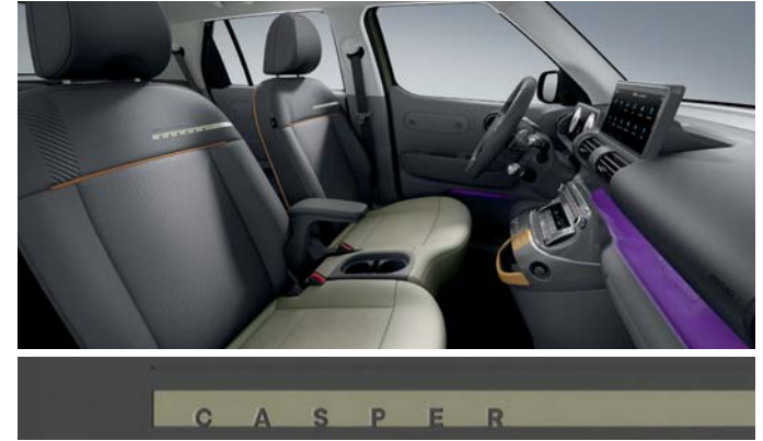
다크 그레이 원톤(인조가죽 시트 / 파스텔 오렌지 포인트)

※ 베이지/카키브라운 투톤 인테리어는 '실내 컬러 패키지(뉴트로 베이지)' 선택 시 적용 가능합니다.